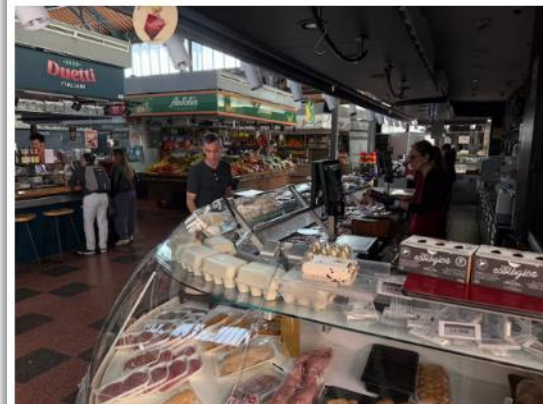
Uitgevallen koelingen in Spanje